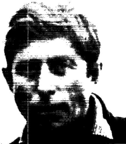
Knud Rasmussen fotografert på den 5. Thule-ekspedition.

en fangststation byggedes umiddelbart nord for Kap Walløe, tæt op til Lindenuvssjørd, som i øjeblikket er Kap Farvel-befolkningens bedste fangstdistrikt.