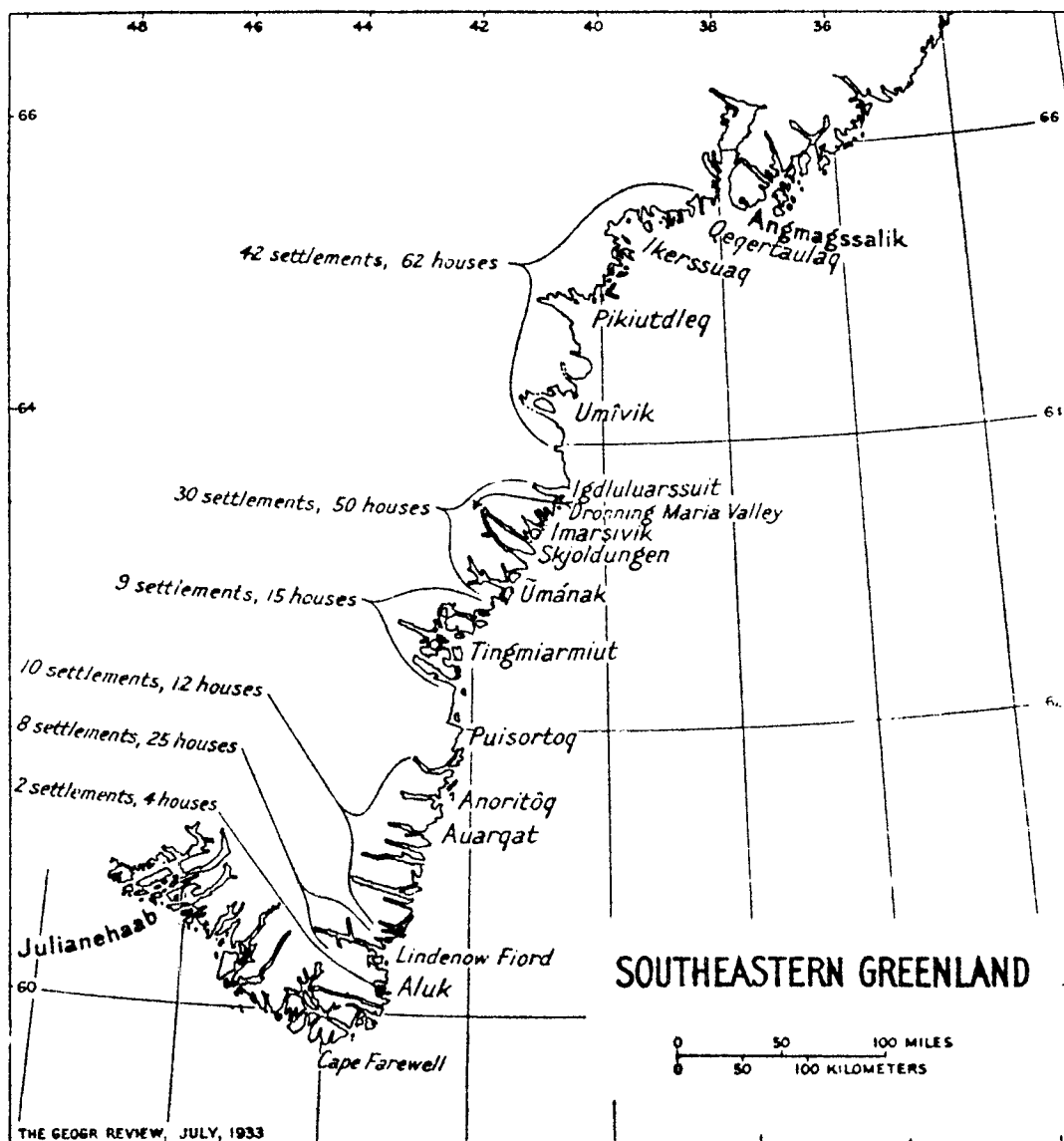
Bopladser registreret på den 6. Thule-ekspedition. Publiceret i The Geographical Review , juli 1933.

derne, her i denne selvsamme dal afsluttede dagen med sang og trommedans.