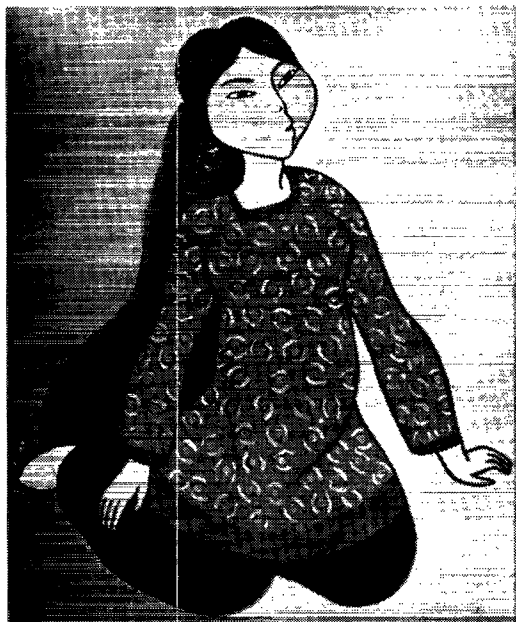
Grønlanderinde fra 1945.

I de dejlige tegninger, Ole Sarvig gengiver i bogen, hører kvindeskikkelserne til de ypperste. Disse tegninger, der viser hans kunstneriske udvikling over en årrække, viser også den store sikkerhed i formen, som han efterhånden op-