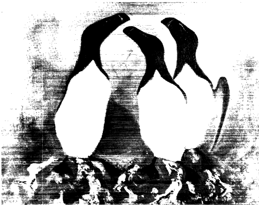
Alke fra 1935.

mers tid, og inden »destruktionsprocessen«, som Gitz kaldte den, satte ind – den »destruktion«, der fulgte med Grønlandskommissionens Betænkning af 1950 og de deraf følgende omvæltninger.