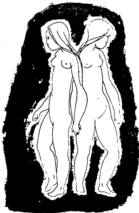
To piger fra Thule.