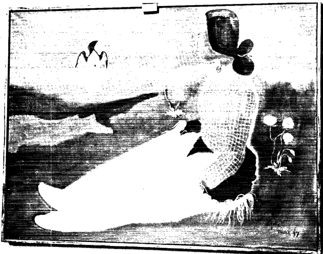
Thulepige fra 1937.

mod at levere et billede til ophængning i Styrelsens kontor. Grønland var jo dengang et lukket land, og man kunne ikke bare uden videre rejse dertil.