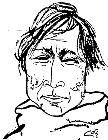
Fanger fra Angmagssalik.

Hans store farveglæde trådte også frem i hans egen påklædning, der var fantasifuld og iøjnefaldende og understregede hans karakterfulde personlighed.