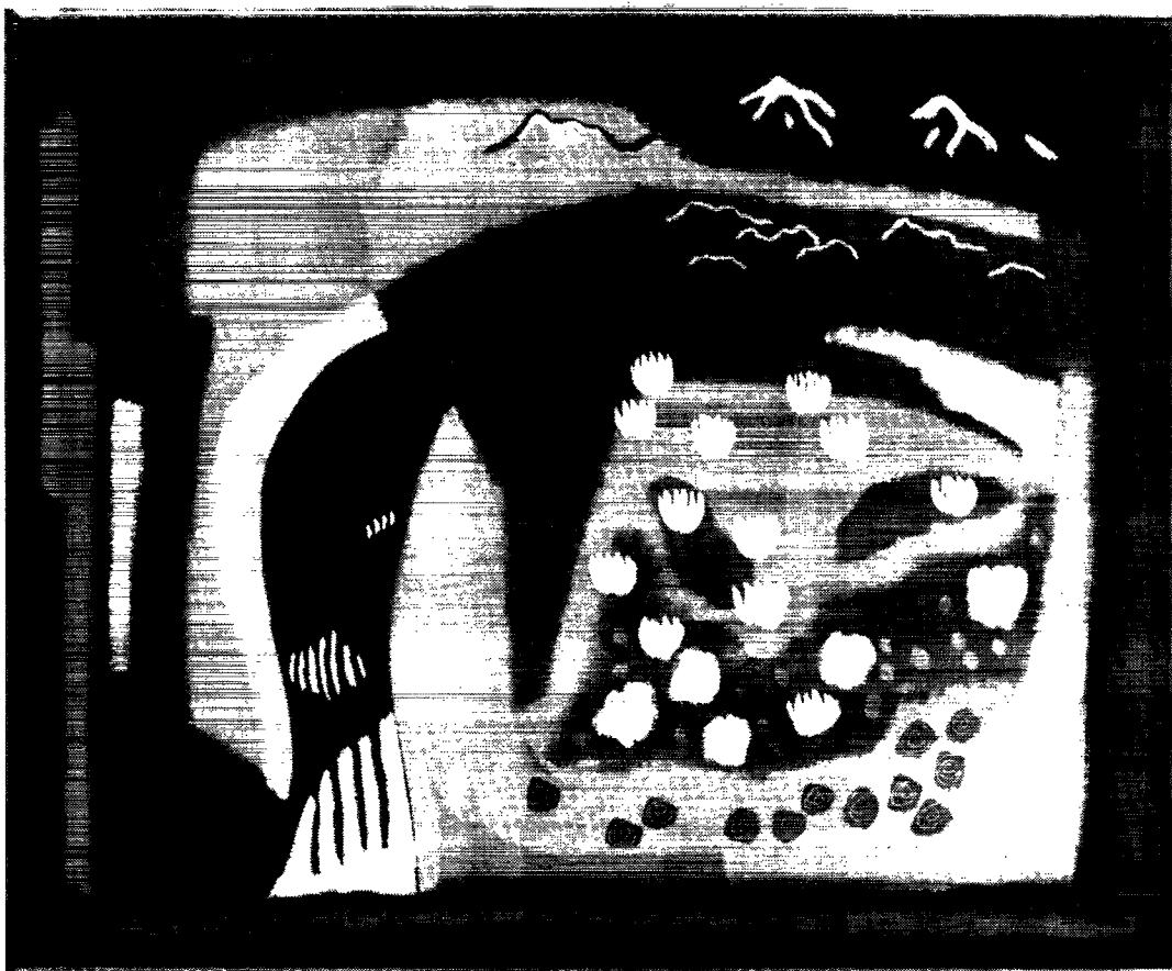
Islommens skrig, 1959.

disse udtalte han: – Denne rejse er meget vigtig, for det er mig meget magtpåliggende at få den helt nøjagtige rosa nuance i en af svingfjerene i snegåsens sommerdragt!