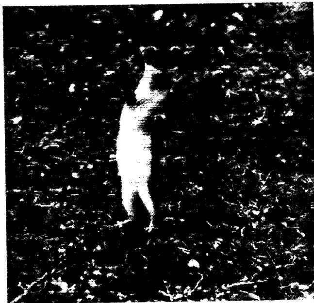
Hermelin, der hviler ud op ad teltbardunen efter nogle rutscheture ned over teltdugen.