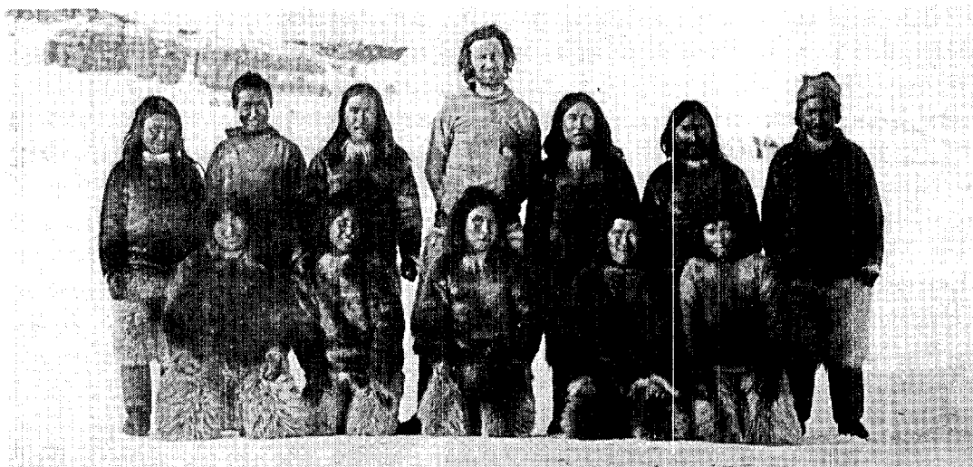
Peter Freuchen rager op blandt en flok inubuit (= polareskimo) jægere. Thule 1912.

indstilling til livet og menneskene – bevirkede, at han fik et enestående kendskab til polareskimoernes liv, tanker og traditioner, en viden om tingene indefra, som næppe er overgået af nogen anden hvid mand.