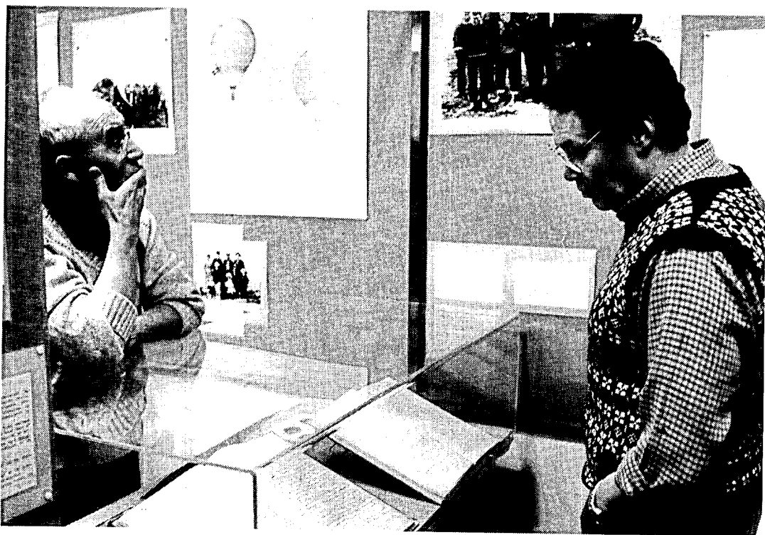
Fra udstillingen på Grønlands Arkiv.

Tilbageførslen af de første 80 meter af i alt ca. 500 meter grønlandske lokalarkiver er blevet markeret dels i form af