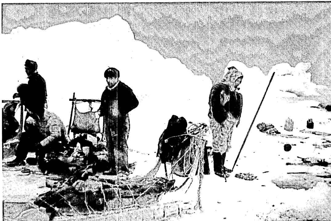
Isfiskeri efter hellefisk på isfjorden. Ilulissat kommune, marts 1969.

massalik 1957 – Skjoldungen samme år – og dog såre charmerende. Der er frysende fiskere med slæde, istuk og fangsthul på isen – man skutter sig og mindes situationen – og dog lyser billedet af liv – slæden er fuldstødt med dejlige, fede hellefisk.