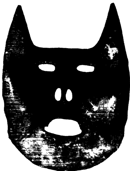
Saqqaq-mandens ansigt? Rekonstruktion baseret på to fragmenter af miniaturomasker udskåret i hvalrostand, 6,5 cm høj. Fundet ved Iglulik i boligtomt fra sidste fase af Præ-Dorset kulturen, 1200–900 f. Kr.

Når vi ser nærmere på oldsager af ben og træ fremtræder de ofte mere karakterfulde og talende. De viser mere specialiserede og sammensatte former og typer, og når det lykkes at følge dem tilbage i tiden fra de historisk kendte eskimoiske våben- og redskabstyper begynder slægtskabet og kontinuiteten at træde frem.