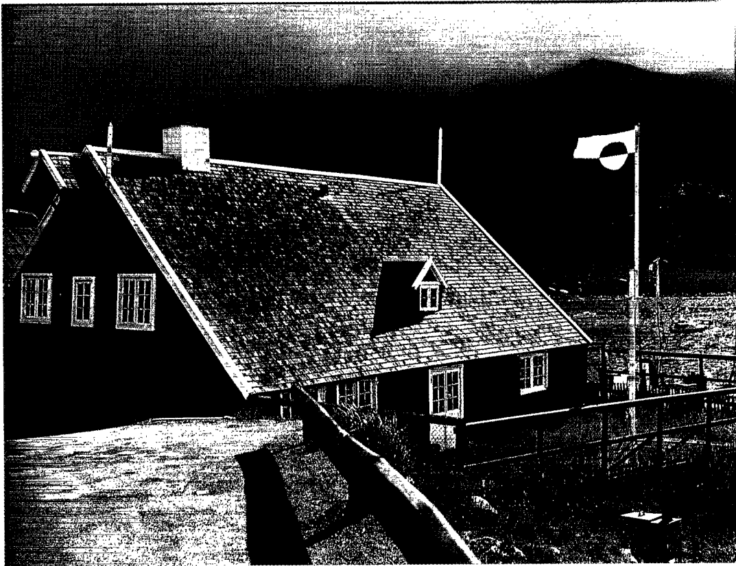
Qasigiannqut Katersugaasiviat/Christianshåb Lokalmuseum, sommeren 1986.

turelle tiltag hårdt. Vi må således sikkert se frem mod en række år, hvor der mere bliver brug for vores overlevelsesevner end for vores evner for luftkastelbyggeri. Fantasien kommer på en hård prøve, hvilket ikke nødvendigvis er af det onde!