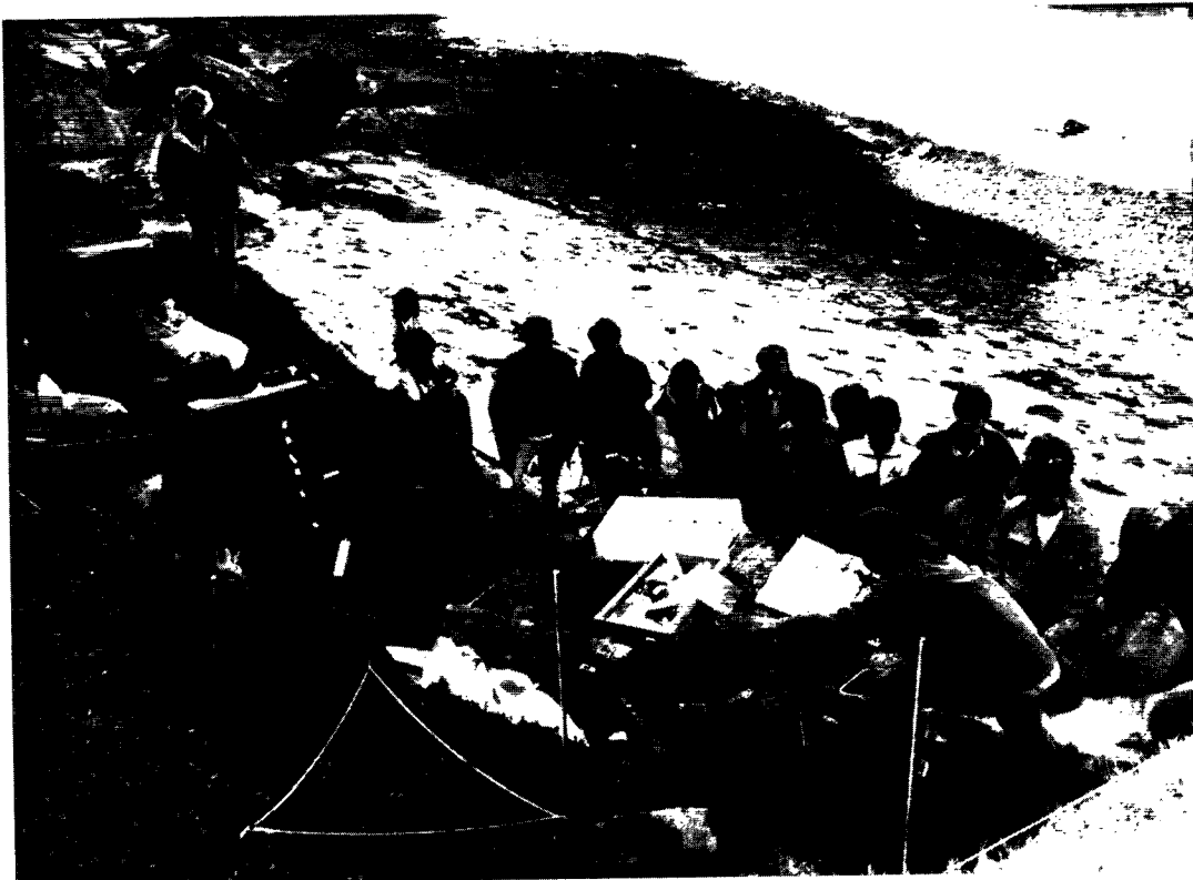
Udgravningerne på Qeqertasussuk har igennem årene været besøgt af talrige interesserede. Her forklares hvad en mødding kan fortælle forskerne.

dene mildest talt væltede op af den kolde og hårde jord. Det stod derfor meget hurtigt klart, at formidlingsproblematikken måtte løses på en fornuftig måde. Åbenheden var alle enige om at sætte højt, hvilket også bevirkede, at folk fra nær og fjern valfartede til øen. Alle der troppede op med et nysgerrigt sind blev vel modtaget.