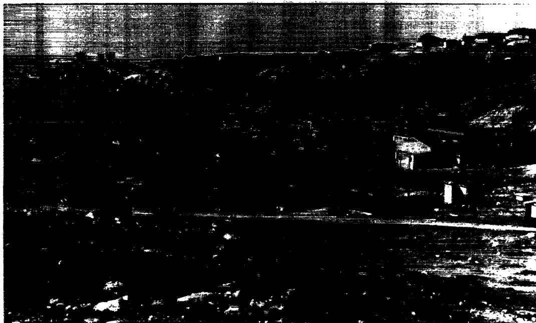
Fra bunden af bugten har byen bredt sig op over fjeldet. De gamle kolonibygninger ligger gemt bag den moderne rejefabriks bygninger.

Der var ikke taget mange forsigtige spadestik i jorden på øen Qeqertasussuk førend forskerne gjorde store øjne. Fun-