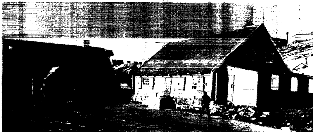
Den gamle materialbutik ses til højre i billedet. Bygningen til venstre er fra 1758 og rummer nu museets kontorer, magasiner, værksted, mørkekammer samt udstillingsrum.

Mange forhold bliver medbestemmende for hvorledes museet i Qasigiannnguit udvikler sig i 90'erne. Kommunens udgrænserende økonomi rammer alle kul-