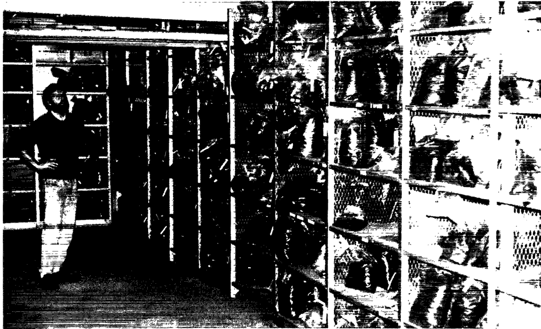
Foruden de egentlige redskabsfund blev utrolige mængder organisk materiale: jord, træ, knogler, ben, tand, skind, fjer m. m. bragt til Danmark til yderligere undersøgelser.