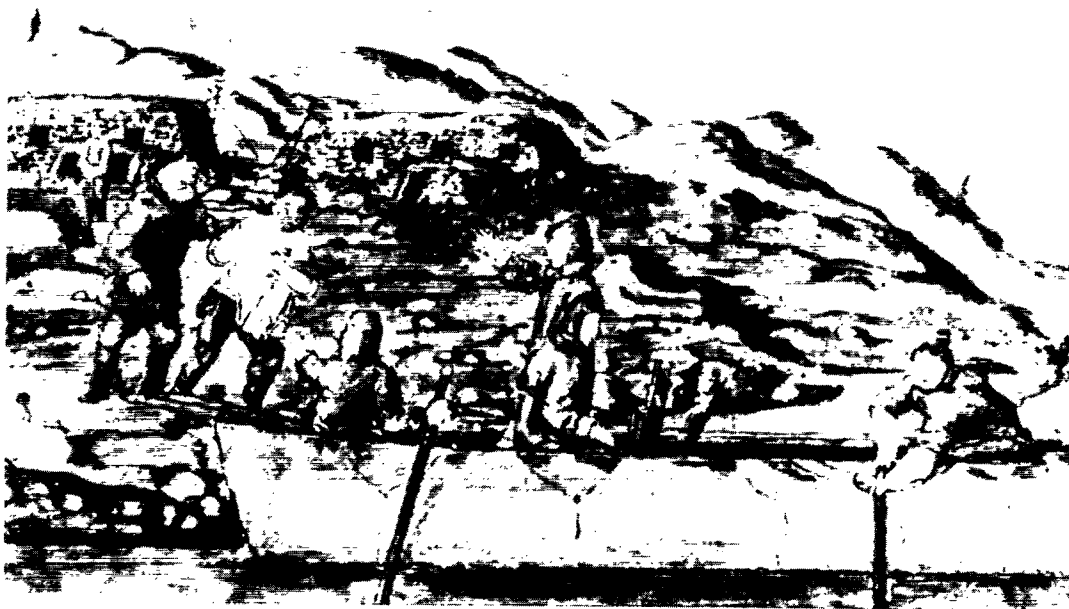
En medhustru sendes bort ved herrnhuternes besøg. Herrnhuterne accepterede kun polygami, hvis 2. ægteskab skrev sig fra tiden før parterne blev gift.