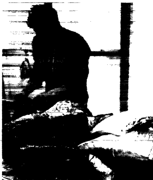
Da vi havde vist os som gode kunder, gav den handlende tilladelse til det obligatoriske turistbillede af brættet. Kødet er nyfanget vågehval.

Sisimiut er byen, der nærmest kom først med alle ting. Her opførtes Grønlands første fiskefabrik i 1927, og i 1930 indviedes Grønlands første skibsværft. I dag kan byen prale af landets eneste offentlige svømmebassin. Hvad det betyder for de yngste, kan enhver overbevise sig om ved at lægge vejen forbi svømmebølen, for den er, som så meget andet her i Arktis, udendørs og i fuld offentlighed. Heroppe er alt synligt. Det gælder f. eks. for fangeren, der lægger til kaj med sin lille jolle lastet med kød og skind. Turisternes kameraer klikker og