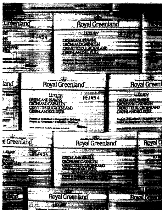
Rejer til hele verden fra fabrikken i Sisimiut.

afhængig af jagt og fangst. Ud over det ødelagte sælskindsmarked står de grønlandske fangere overfor nye trusler. Den Internationale Hvalfangst Kommission (IWC) har planer om at forvalte fangst af småhvaler. Småhvalsfangsten har stor betydning for den daglige økonomi og er indtil nu retmæssigt blevet forvaltet af Hjemmestyret. ISI mødet vedtog en resolution, som skarpt fordømmer IWCs planer.