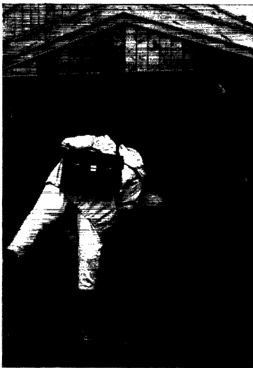
»Nysgerrighed skal der til.« Sisimiut museums nye tørvehytte.