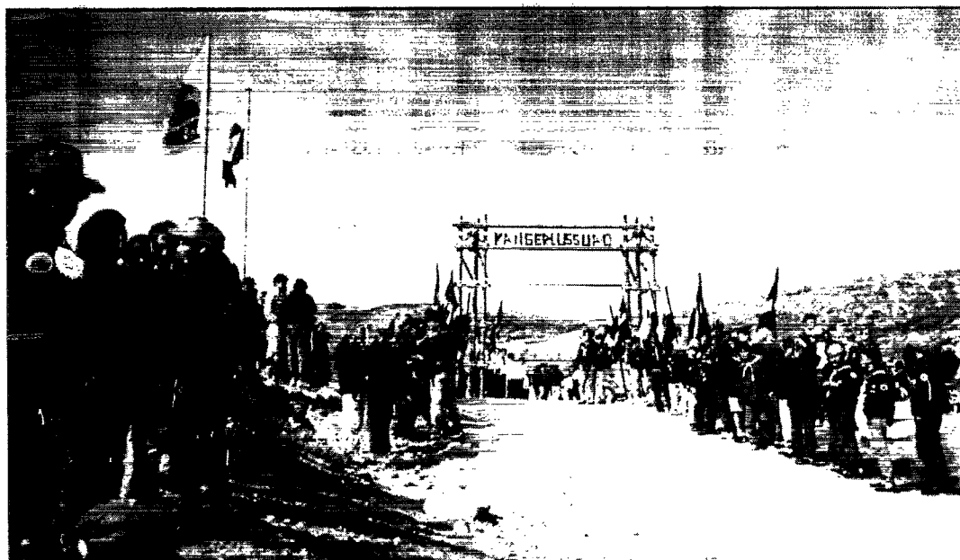
Klar til at modtage H. K. H. prinsesse Benedikte ved indgangsportalen.

og at risikoen for driftskader var stor. Det blev en kilde til en meget stor prøvelse på alles temperament, tålmodighed, hensynsfuldhed og fysiske evner.