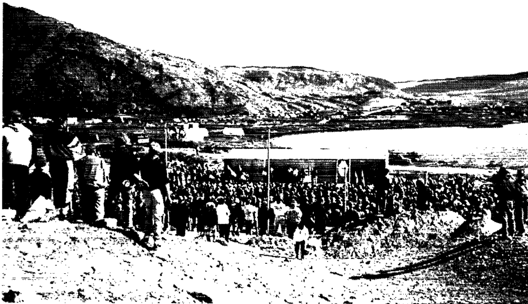
Den østlige lejrhaldel med parade- og lejrbaalsplads i forgrunden.

ren), latrin- og vaskehusene, og så selve lejrpladsafmærkningen.