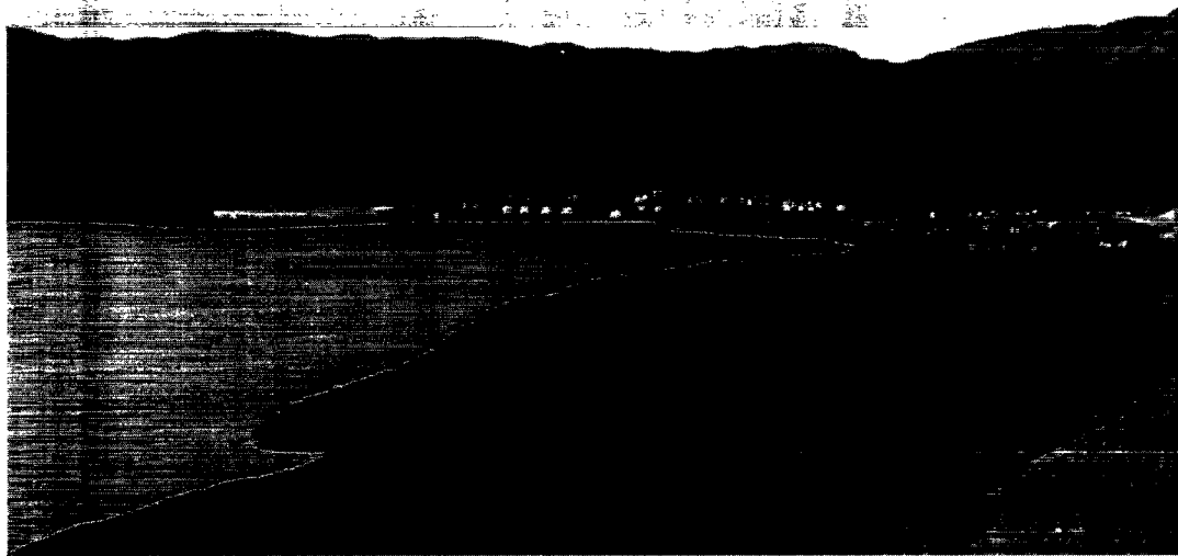
Den vestlige lejrhalvdel.

menhæng – i sig selv en unik idé og tanke.