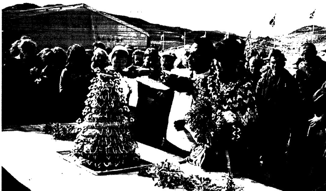
Grønlandskage som bryllupskage.

Spejderne kunne også tage på vandreture, kombinere køre- og vandreture til indlandsisen, eller sejle i en af Sdr. Strømfjords små sidefjorde for at opleve fuglefjeld, fiske m.m. Der var også ture til besigtigelse af moskusokser eller årtusind gamle fossiler.