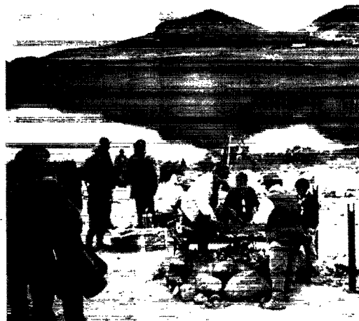
Moskusoksebøffer på grill.

Ingen havde vist forestillet sig, at de gamle og næsten udslidte køretøjer skul-le behandles med så megen varsomhed,