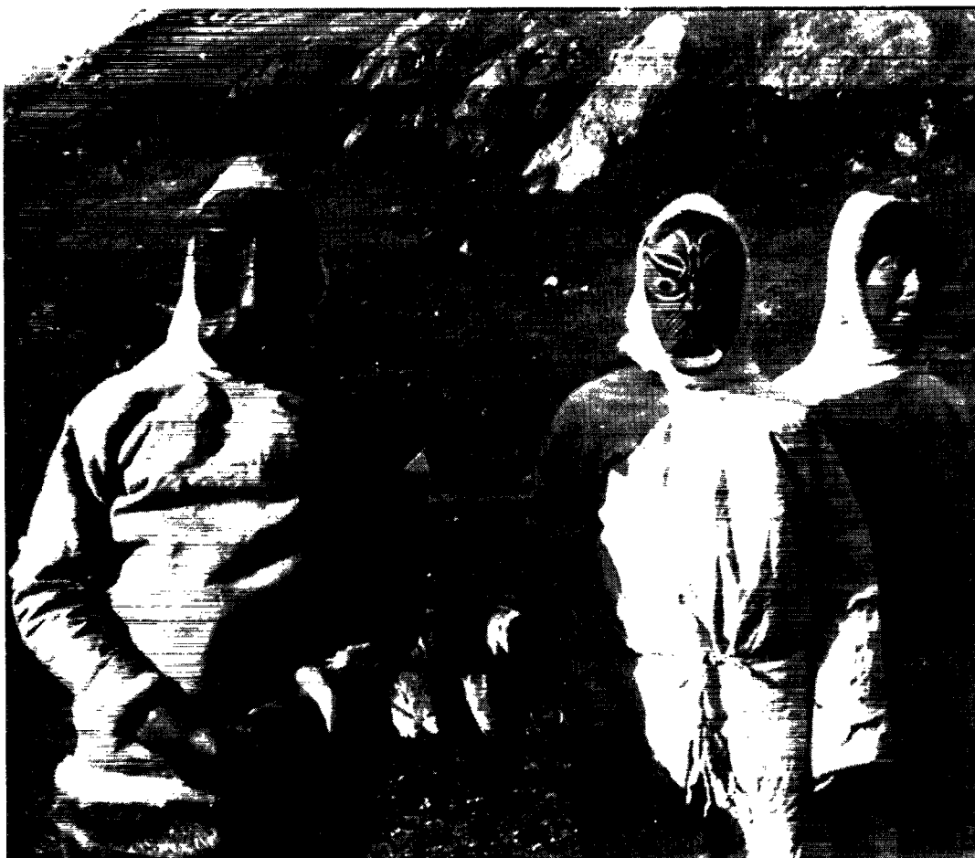
Fra en fest i Ammassalik i begyndelsen af 1930'erne.

sendt illusionen på flugt (Mathiassen 1933:144). Eller som da han beskriver den åndemansscene, han overværede i Kuitses store fælleshus i Kulusuk, som åndemaneren Avgo's barnebarn Salomon holdt: Med slukkede lamper fyldte han luften med de mest bemærkelsesværdige lyde, banken, trommen, syngen, skrigen, hvæsen, hylet og hysen og forstyrret tale – og så, når lamperne blev tændt og et selskab af folk på omkring 70 stykker i bomulds anorakker, uldne sweaters and stofbukser brø-