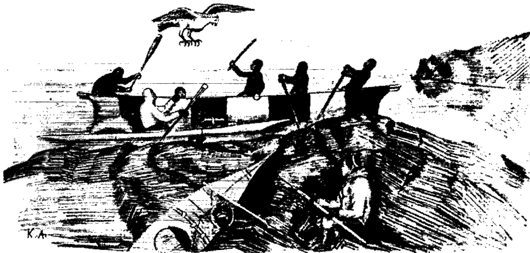
En af Kaarale's illustrationer til Knud Rasmussens: Myter og Sagn fra Østgrønland. »En troldbåd overfalder åndemaner Avggo, der er flygtet op på et sted, hvorfra han forsvaret sig ved hjælp af sin hjælpeånder, kæmpefalken og »den skævmundede«. Troldbådene røver ensomt rejsende og er let kendelige fordi de er betrukne med sorte og hvide skind«.

nemlig ingen tvivl om, at den tidligste kultur i Ammassalikområdet havde sit udspring i den vestgrønlandske Inussuk-kultur, således som han kaldte den sene Thule periode fra omkring 1500 tallet svarende til slutningen af den norrøne periode i Grønland. Arkæologisk blev Therkel Mathiassens konklusion at Ammassalikkulturen må anses for en gren af den vestgrønlandske kultur . Hvis han har ret, var der jo så i nyere tid tale om en tilbagevendende til kulturudspringet!