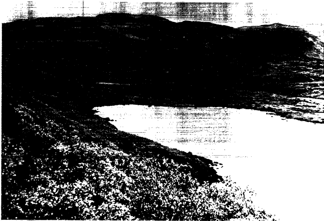
Ruinområdet set fra vest. Foto: C. L. Vebæk 1948.

Sand. Murens Tykkelse var halvanden Alen, Husets Længde uden til 21 Alen og Bredden 9 Alen. Huusmuren mestendeels runden om i Mands Højde fra Jorden. Indgangen har været paa den sydøstre Side. Huset vendte mod N.O. og S.V. I den sydvestre Ende var ved en Muur afdeelt et Rum, neppe tre Alen langt og Indgangen derfra til det større Rum var neppe halvanden Alen bred. Endskjøndt Muren endnu stoed saa høj, som før er meldt, kunde jeg dog intet Spoer see, at der har været Vindver paa samme, veed derfor ikke, om det har været et Vaaningshuus, hvorledes Beboerne af samme have havt deres Lysning,