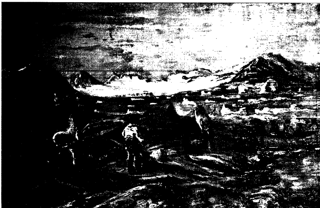
Udsigt over Ammassalik. Maleri af Peter Rosing.

tioner til landskabsmalerier, og samtidig kunne han også hjælpe lægen med lidt tolkearbejde. Dengang var der ikke noget der hed betaling for tolkearbejde på rejser, så jeg var glad for til gengæld at kunne være behjælpelig med nogle formalia, da hans datter søgte ind på jordemoderskolen i København.