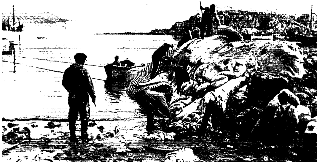
Flænsning af blåhval (han, 25 meter) i Uummannaq, 20. juli 1948.

begavet naturiagttagere, og dertil var han specielt interesseret i havebrug med en mesterlig evne til dyrkning af grøntsager og blomster i værksthus og i drivbænke, og da vi drog videre, var vi rigt forsynede med de dejligste grøntsager.