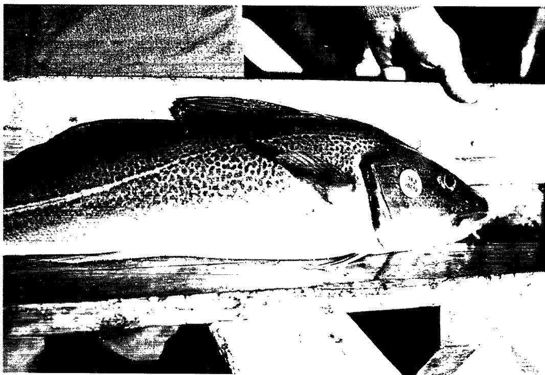
Torsk mærket i gællelåg. Foto: Erik Smidt, Nuuk/Godthåb, 14. august 1959.

kosten var vore egne fangster af fisk og rejer, men også jagt på søfugle som tatteratter (rider), lomvier og edderfugle kunne bidrage til kosten. Hjemmefra havde vi provianteret i røget flæsk, æg, smør og øl. Da de grønlandske bagerier kun bagte rugbrød og sigtebrød, blev det et vigtigt hverv for kokken at bage franskbrød.