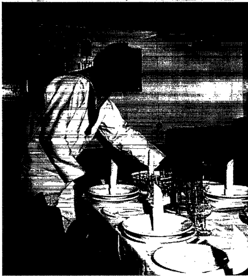
Hovmesteren på inspektionskutteren Mallemukken, langt senere redaktør af tidsskriftet, dækker op til en amerikansk ambassadørs udflygt i Godthåbsfjorden, sommeren 1961.

Du begyndte dit liv med Grønland i starten af 60-erne som værnepligtig gæst i inspektionskutteren »Mallemukken«. Du fik blod på tanden og nogle år senere var du sælfanger i Upernavik, eller var det bjørnejæger?