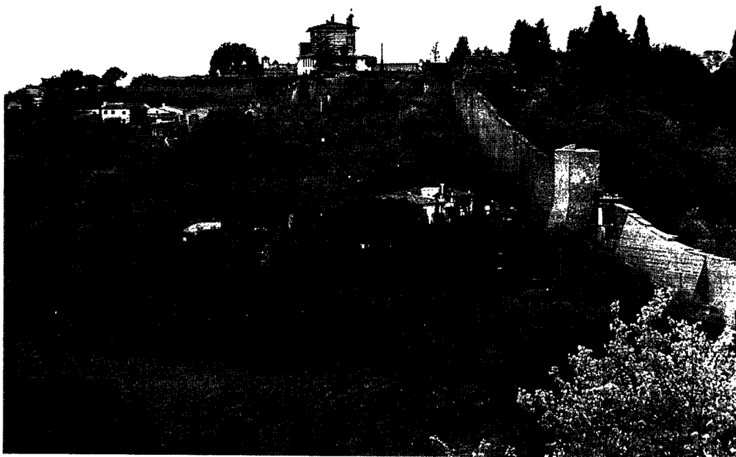
Firenze med bymur omkring, som det omtrent også har set ud, da Frederik IV besøgte byen.

nået 4 »caramuccer«, dvs. nogle »kære små nogle«, til Firenze, så var der jo en mulighed for, at det kunne være grønlandere, der her var tale om?