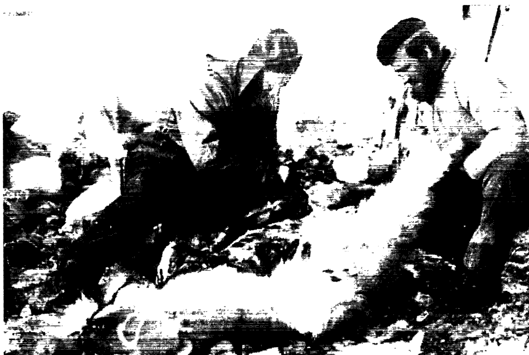
Et isbjørneskind skrabes rent for fedtresten i den lune forårssol ved Polarheimen. (Sverre Storholt).

sommeraktiviteter og fælles gøremål. Samtidig var den samlingspunktet, når fangerne havde været på længerevarende fangstture. Til stationen hørte et større fangstområde, som var delt op i nogle mindre terræner, så hver fangstmand havde sit eget.